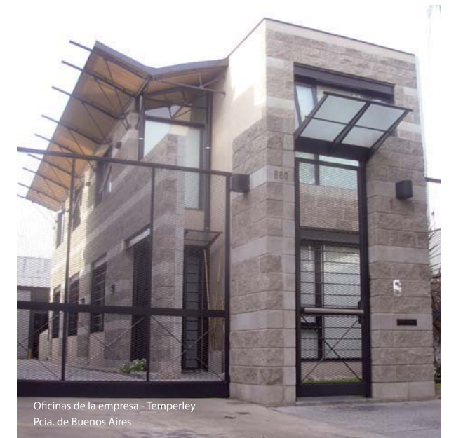
Oficinas de la empresa - Temperley Pcia. de Buenos Aires

Todo ello se ha logrado merced a la participación de profesionales de marcada solvencia técnica, manteniendo una cuidada logística, capacitando permanentemente a nuestro personal en relación a las nuevas tecnologías aplicadas a la construcción, efectivizando un sostenido control de calidad, contando con la infraestructura adecuada como asimismo con la solvencia financiera que en el caso se requiera.